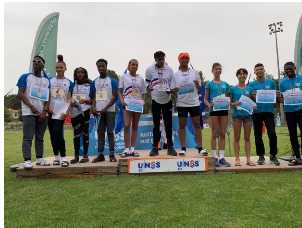
Podium des 4*200m - Championnats de France de Relais Vergèze 2019 Collège Edouard Herriot de Livry Gargan – Médaillé d'Argent.