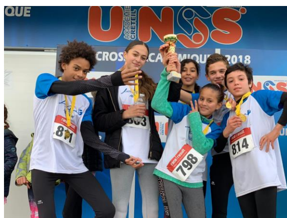
Nos 6 Benjamines et Benjamins Champions Académique de Cross, le 19 décembre 2018. Et 5 ème au Championnat de France de Cross à Bordeaux du 25 au 26 janvier 2019.