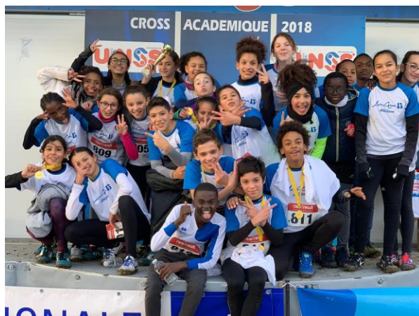
Tous nos Benjamines et Benjamins, qualifiés au Cross Académique 2018 et fêtant le titre de leurs partenaires.