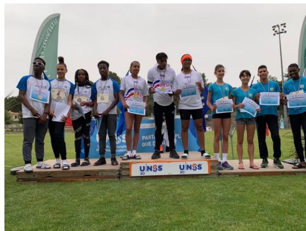
Podium des 4*200m - Championnats de France de Relais Vergèze 2019 Collège Edouard Herriot de Livry Gargan – Médaillé d'Argent.