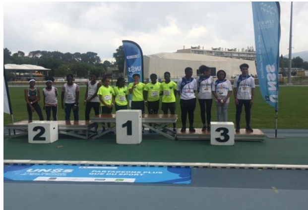
Podium des 4*200m - Championnats de France de Relais Aubagne 2018 Collège Edouard Herriot de Livry Gargan – Médaillé de Bronze.